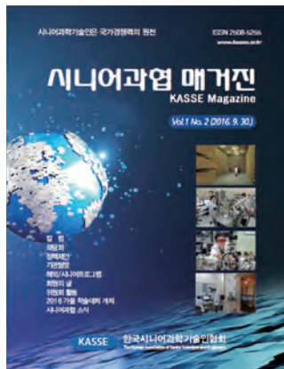
제1권 제2호(2016년 9월)