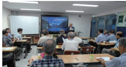
2016년 8월 11일 과학홍보대사를 위한 워크숍