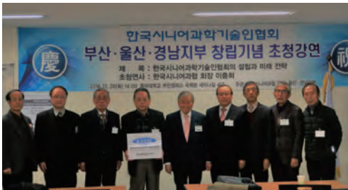
2016년 12월 20일 부산·울산·경남지부 창립