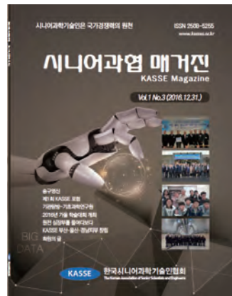
제1권 제3호(2016년 12월)