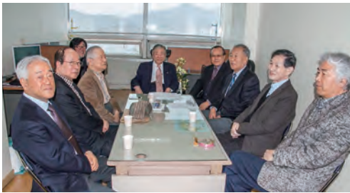
2016년 4월 2일 제1회 회장단회의