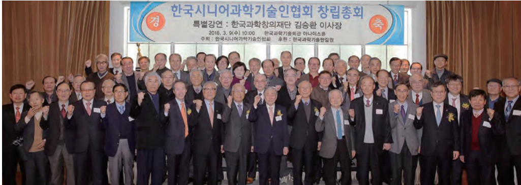
한국시니어과학기술인협회 창립총회 기념

1. 우리는 100세 시대를 맞이하여 국가경쟁력의 원천인 시니어과학기술인의 축적된 지식을 활용하여 과학기술인의 생애 전주기적 활동과 건강한 삶으로 과학기술 발전에 기여하고 지식봉사와 회원의 복지증진을 목적으로 (사)한국시니어과학기술인협회를 창립한다.