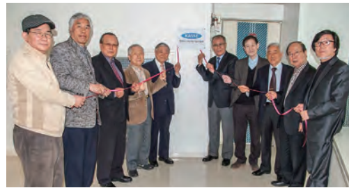
2016년 4월 2일 현판식